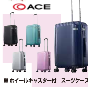
W ホイールキャスター付 スーツケース