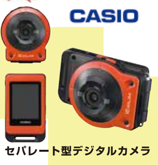
セパレート型デジタルカメラ