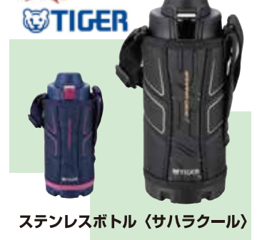
ステンレスボトル〈サハラクール〉