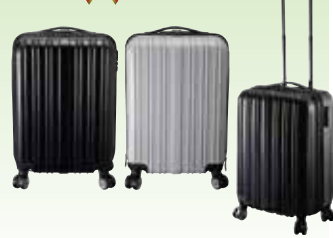
イーエムエンジニアリング キャリーバッグ