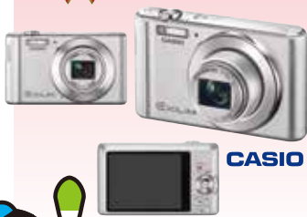
カシオ デジカメラ EXILIM EX-ZS240SR