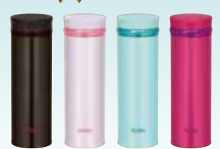
THERMOS サーモス 真空断熱ケータイマグ 350mL