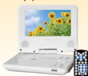
MATURUS CPT-790 ポータブルDVDプレーヤー