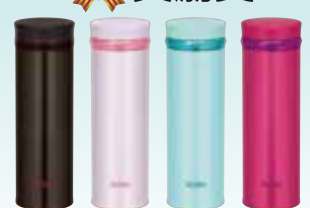
THERMOS サーモス 真空断熱ケータイマグ 350mL