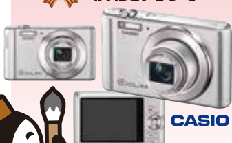
カシオ デジカメラ EXILIM EX-ZS240SR