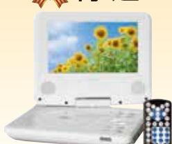
MATURUS CPT-790 ポータブルDVDプレーヤー