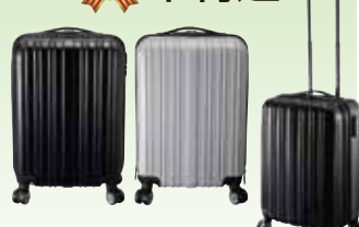
イーエムエンジニアリング キャリーバッグ